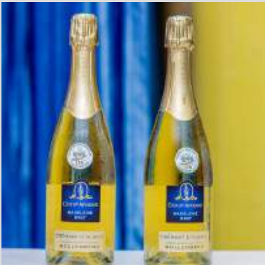
DEGUSTATION DU CHAMPAGNE DU DOMAINE DU BOLLENBERG