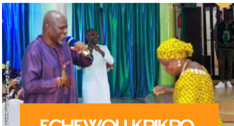
ECHEWOU KPIKPO DES MAMANS A L'HOTEL